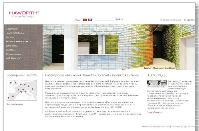
Der internationale Büromöbel-Hersteller Haworth (comforto, dyes) betreibt seine europäischen Webpräsenzen zwischen Lissabon und Moskau mit InfoSite.

Die Prinzipien des „Active Caching“ sorgen hierbei für hochperformante Webseiten bei vergleichsweise geringem Hardware-Einsatz. So pflegen beispielweise einige Hochschulen ihren Internetauftritt, der täglich von mehreren tausend Besuchern aufgerufen wird, mit InfoSite. Auch bei einer hohen Anzahl von aktiven Redakteuren, die parallel mit InfoSite arbeiten, treten keine Verzögerungen auf. Das System meistert somit auch anspruchsvolle Aufgaben souverän und schont dabei vorhandene Ressourcen.